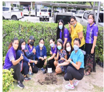
กิจกรรม ประชุมการด้านทฤษฎีและการจัดการผลประโยชน์ทับซ้อน